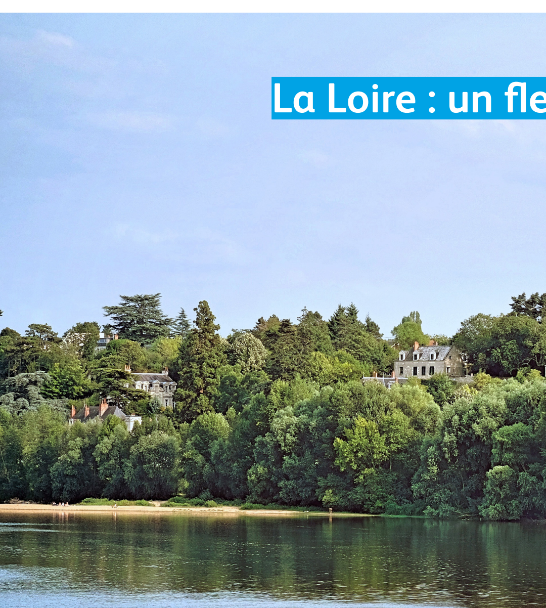
La Loire : un fleuve à retrouver