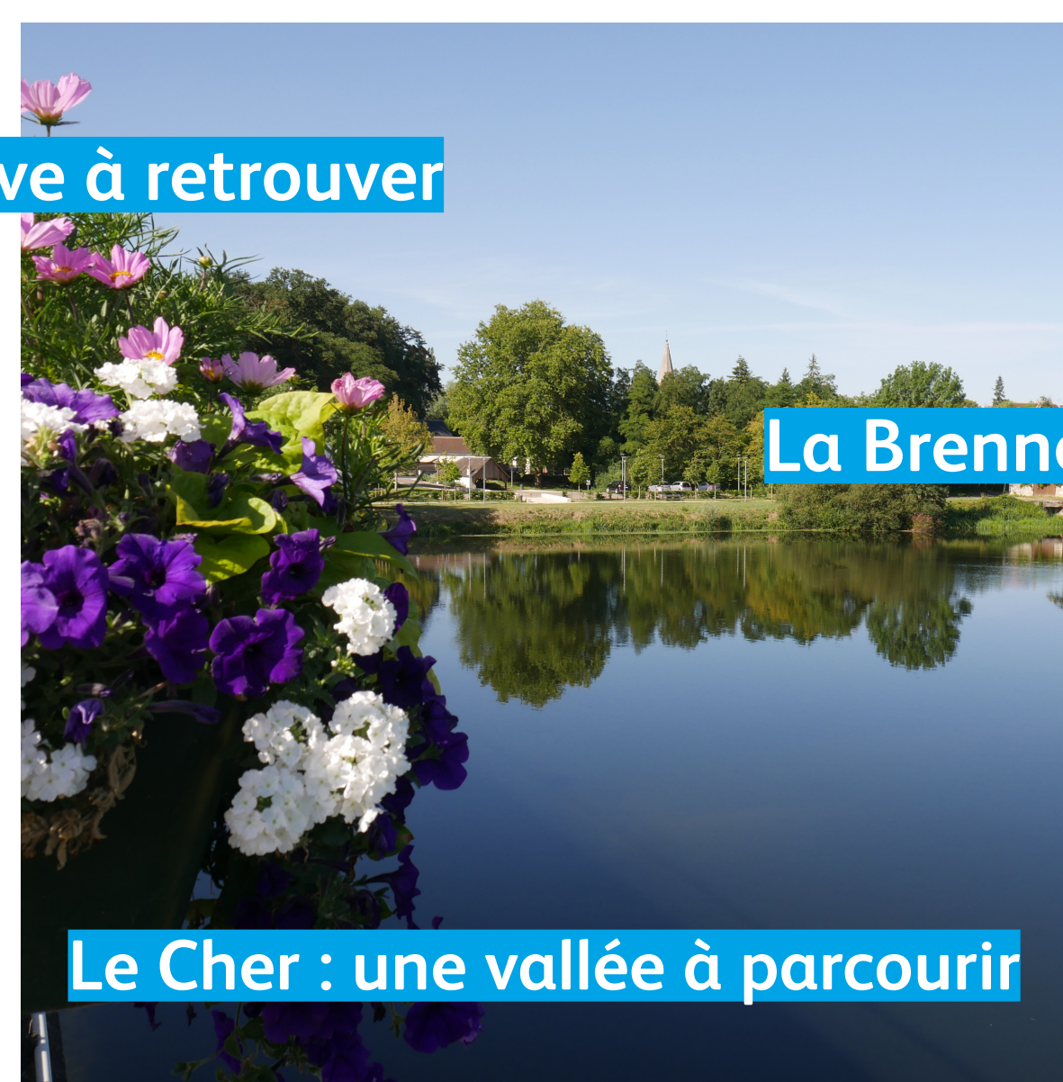
La Brenne : un trait d'union porteur de projet