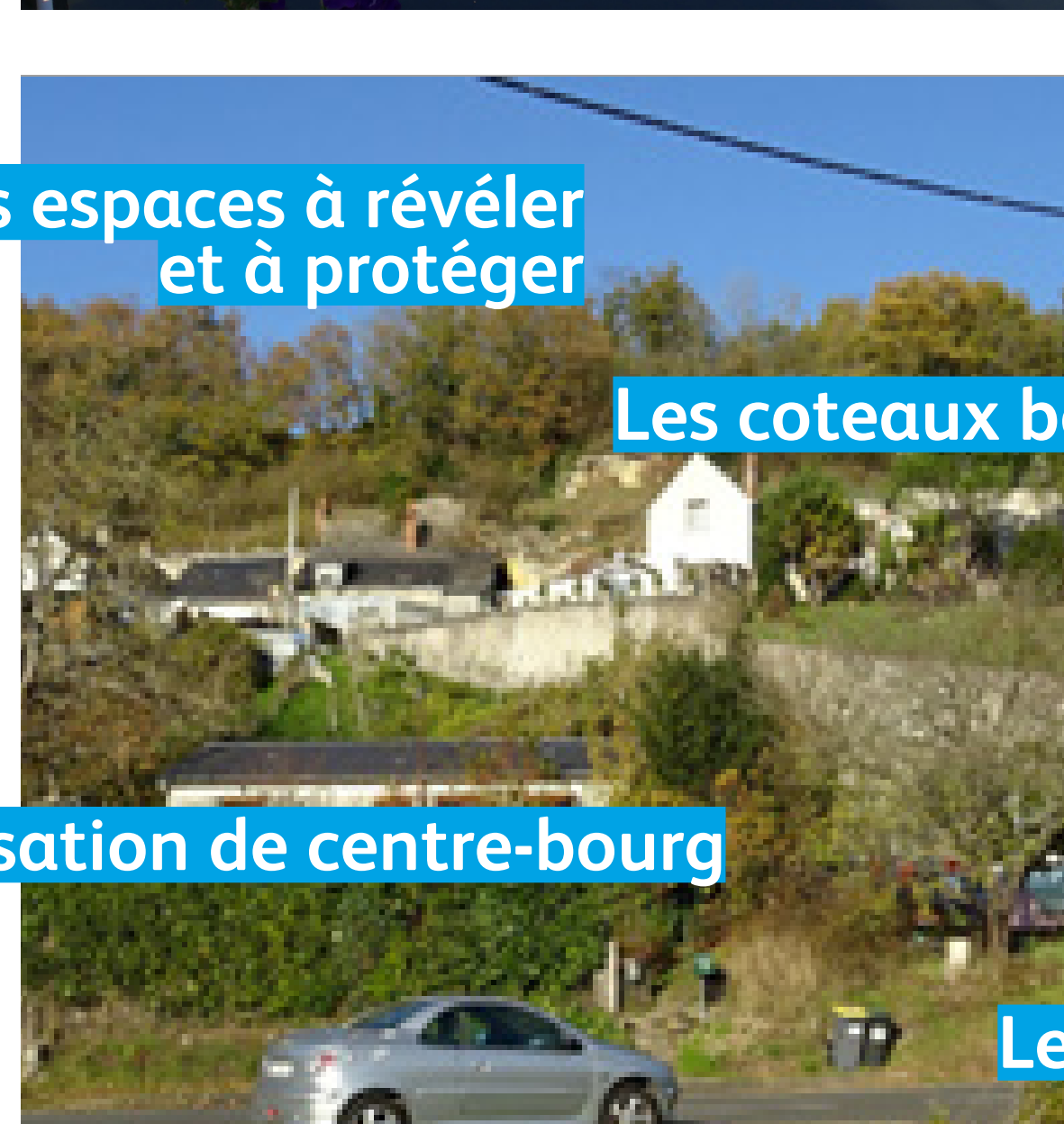
Les coteaux belvédères