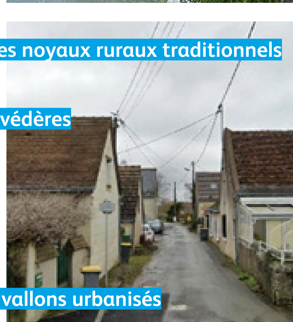
Les noyaux ruraux traditionnels