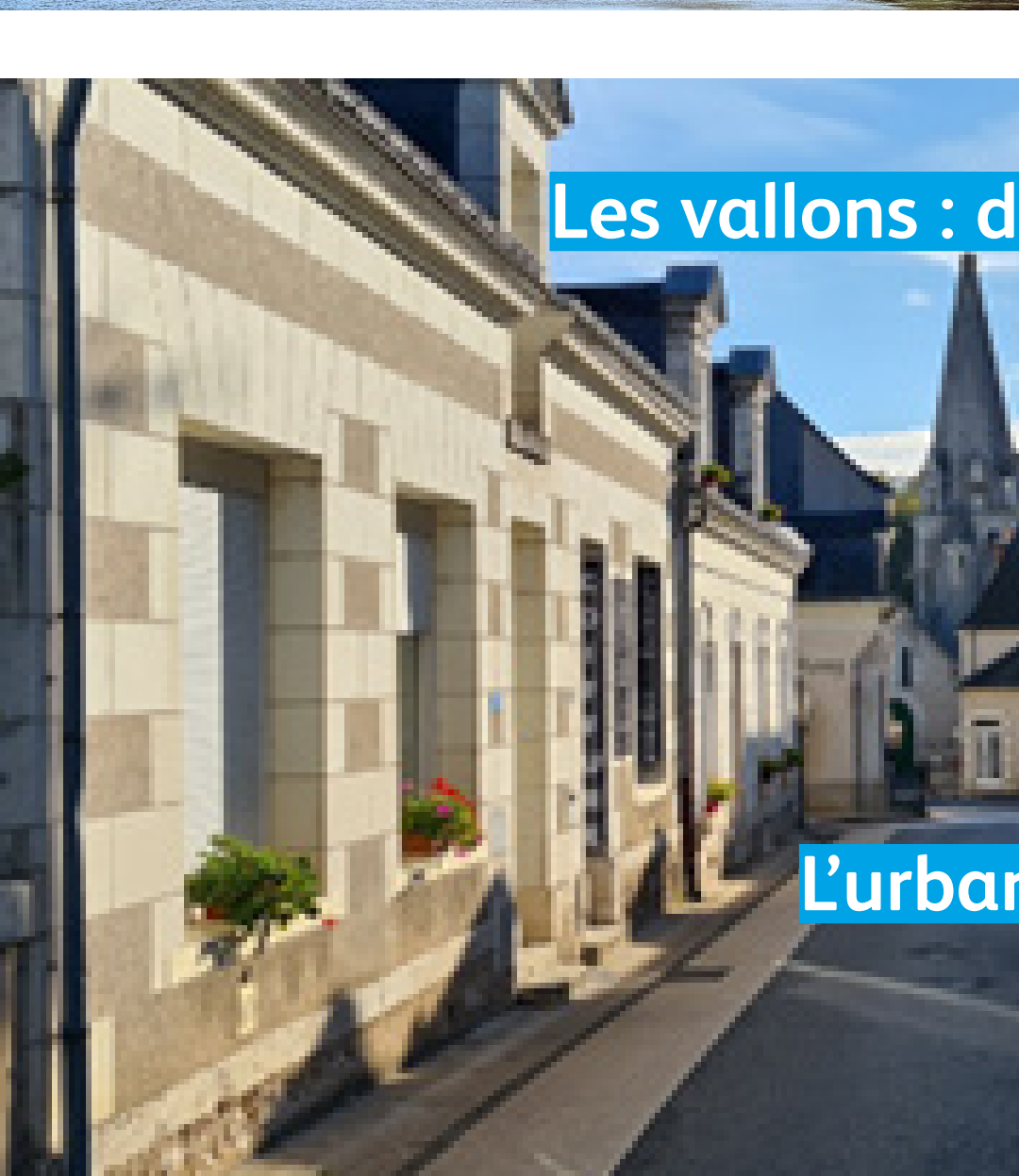
Les vallons : des espaces à révéler et à protéger