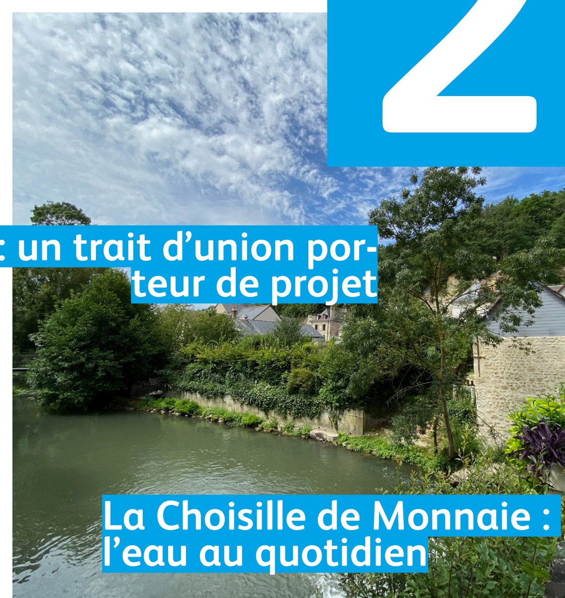
La Choisille de Monnaie : l'eau au quotidien